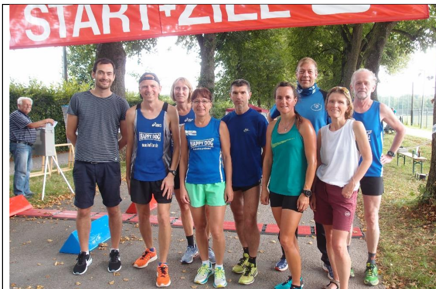
Mit einer Herren- und einer Frauenmannschaft auf der Marathondistanz Und einer Mannschaft auf der Halbmarathonstrecke traten die „LG-Läufer“ Beim Staffelmarathon am 01.09.2019 an.

Weitere Bilder finden sich im Ordner „Sonstige Bilder“